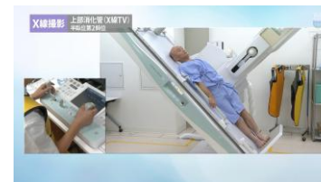
医用画像・診療放射線動画 Medical Imaging