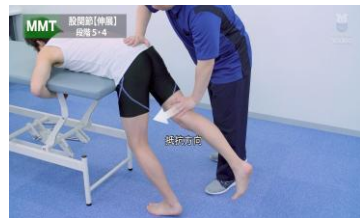
理学療法 physical therapy

メディカルオンラインビデオは医師や看護師、医療技術者、学生など、あらゆる医療関係者のための新しい医療動画配信サービスです。手術や各種手技など、多彩なラインアップで学生から医療従事者まで幅広い層にご利用いただけます。