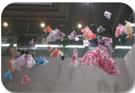
金魚柄 ：金魚の柄を元に見て楽しいポップなデザインを考え、染料で手描きした布で金魚のぬいぐるみモビールを制作しました。 デザイン学部 宮本幸枝

ギャラリーとして展示した作品をご紹介します。 金魚柄：平成 25 年 7 月 29 日～11 月 7 日まで blue rayer・スカート・spill：平成 25 年 10 月 24 日～11 月 21 日まで