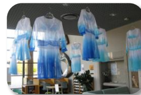
blue rayer ：思春期の気持ちは不安定で移り替わりやすいものです。 デザイン学部 大山鈴加