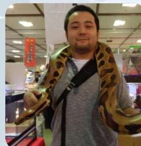
名古屋で開催された爬虫類展にて

学生時代 学生時代は図書館のPCのメンテナンスを行っていました。 現在 愛知県でソフトウェア技術者として働いています。車関係の仕事で、難しいソフト、データと格闘してより良いものができるよう日々奮闘しています。某社の車に乗っている人はもしかすると自分が関係したソフトが積まれているかもしれません。 趣味 蛇とかのいわゆる「ゲテモノ食材」を食べたり、高所恐怖症なのにバンジージャンプしてみたり、ロードバイク始めたり、いろいろ挑戦しています。 アドバイス 在学生の皆さんに大学時代に是非しておいて欲しいことは、「(食べる以外で) ストレス解消法」を見つけることです。精神面のマネージメントができていないと、仕事やプライベートで、ここぞというときに全力が出せません。また、「情報が正しいか疑う」ことです。ネットだけでなく、本や人の意見も取り入れて、思い込みで仕事をしないように癖をつけておきましょう。 ひっこ 社会人になると体重が増える人が多いです。私も含めて 1 年目に 10kg とか変わっちゃう人いるので、何か続けられる運動をやっておくといいですよ。