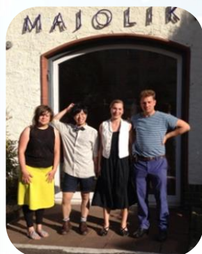
展示のオープニングにて

卒業後 ドイツ国立カールスルーエ芸術アカデミーに進学しました。 現在 ドイツに住んで約 4 年、彫刻作品を今も作り続けています。最近では、居住地カールスルーエをはじめ、ベルリン、ケルン、パーセルなど、様々な場所での展示の機会に恵まれました。また昨年から、国内唯一のドイツ国立マジョリカ製陶工場のゲスト作家として招待され、滞在制作を定期的に行っています。そこでは職人の方々から技術面のサポートをしてもらいながら制作という貴重な体験をさせて頂いています。今後は、アートフェアや美術館での展示が予定されており、本当に楽しみに思っています。 アドバイス ここまでやってこれたのは、これまでに出会った先生や友人など、色々な人に支えられてこそ。人と出会い、そして様々な出来事と自分らしく丁寧に向き合う事は、本当に大切だと実感しています。 ひっこ 皆さんの素敵な人生を願っています。